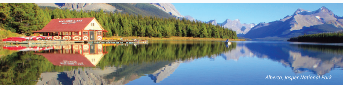
Alberta, Jasper National Park