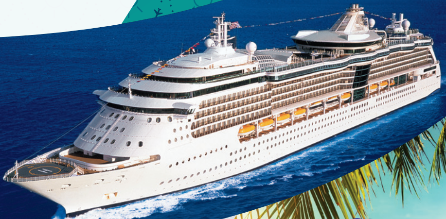
Serenade of the Seas