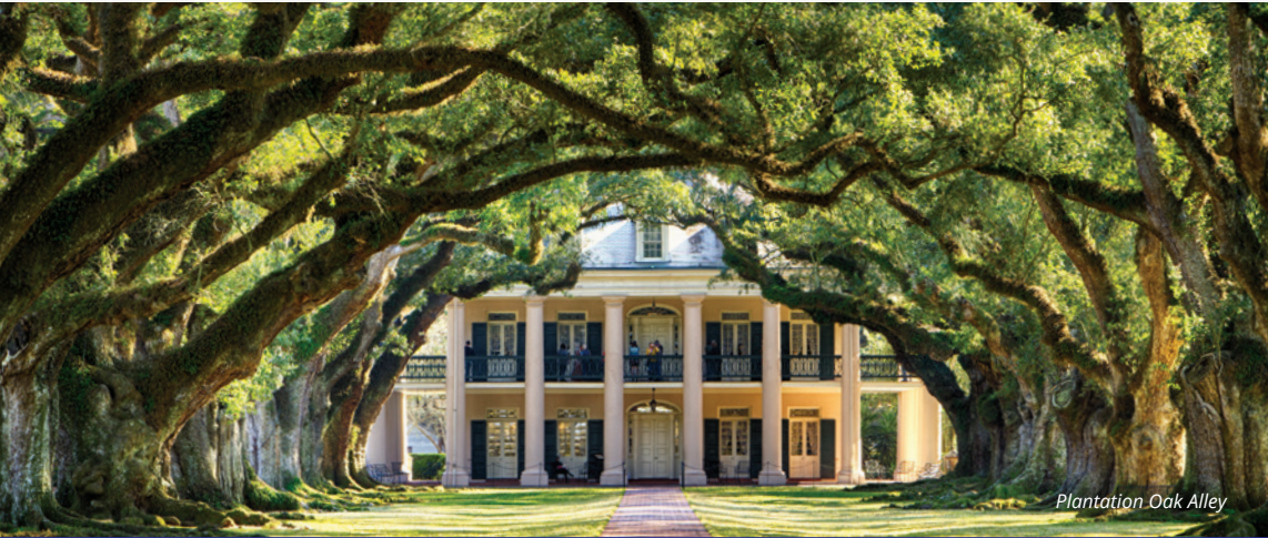
Plantation Oak Alley